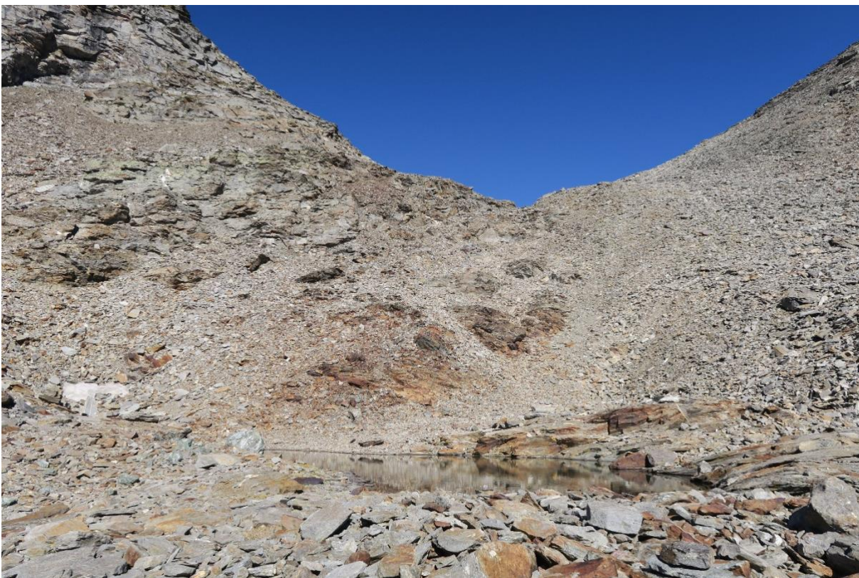
Und gegen Nordosten zum Vogeljoch