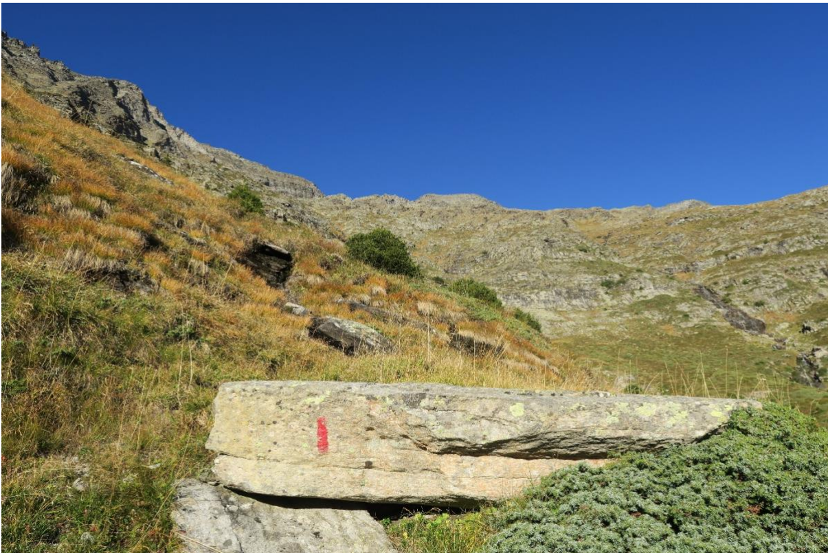
Blick vom Weg nach der Alpe Cardedo zum Vogeljoch

https://map.schweizmobil.ch/?lang=de&showLogin=true&bgLayer=pk&logo=yes&season=summer&resolution=10&E=2724407&N=1149507&trackId=2633029