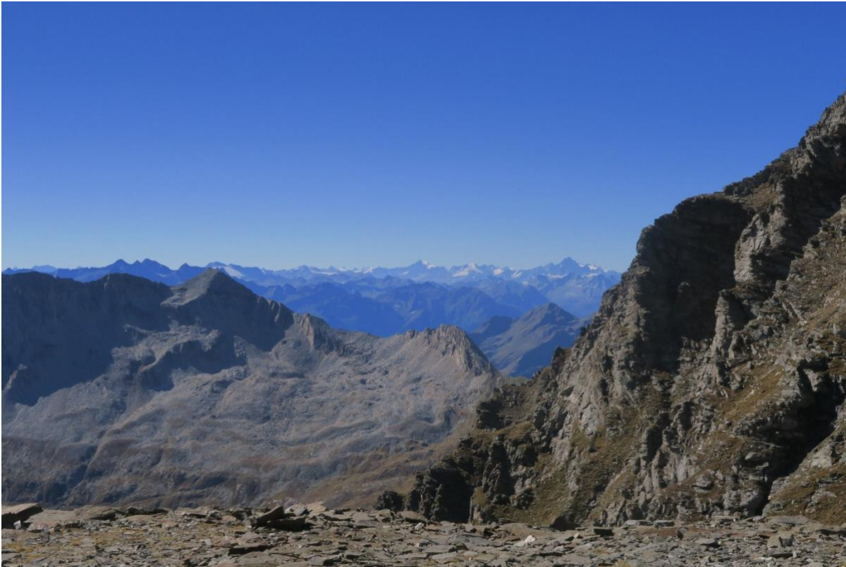
Ausblick von der Piane del Baratin gegen Südwesten mit der Monterosa im Hintergrund