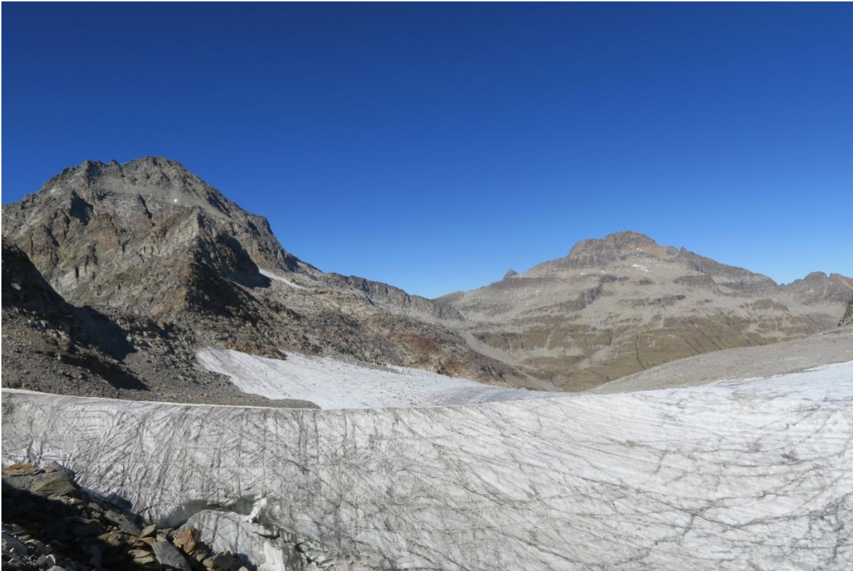
Der Paradisgletscher mit dem Rheinwaldhorn, dem Güferhorn und der Läntalücke in der Mitte