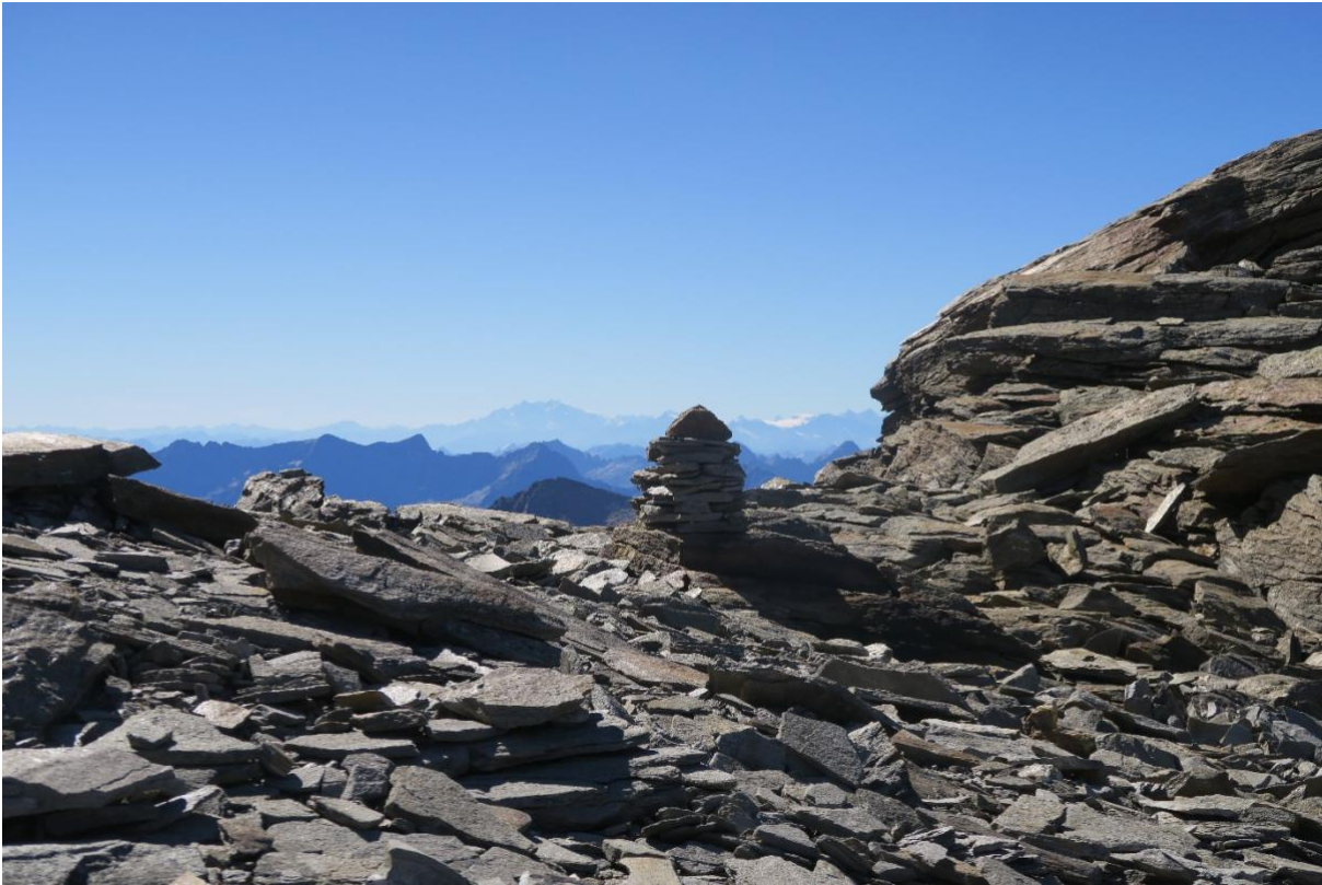
Auf dem Vogeljoch wieder mit der Monterosa im Hintergrund