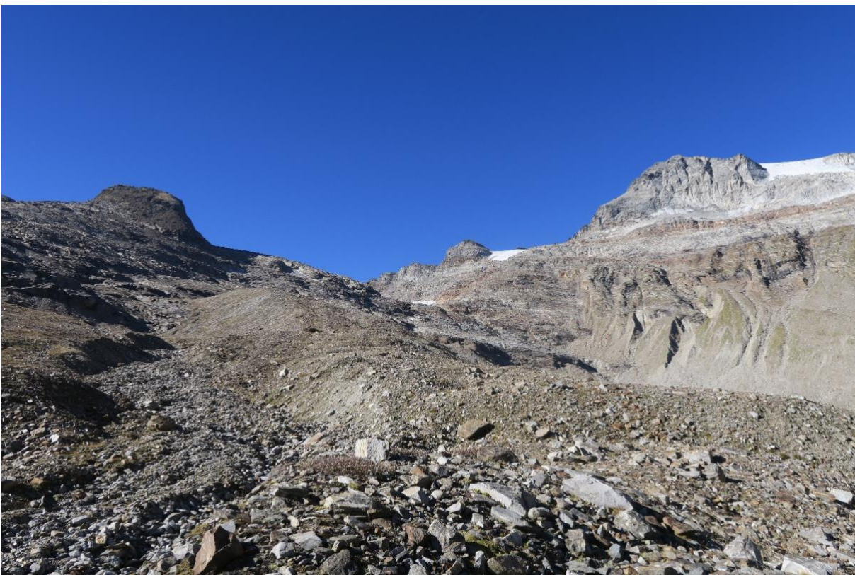
Links die Gemskanzel und rechts das Rheinwaldhorn vom Ursprung des Hinterrheins gesehen